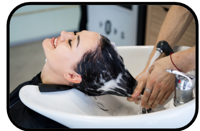
12. hair salon