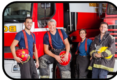
11. fire station