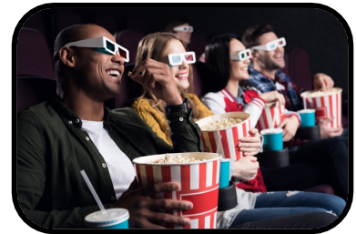
6. movie theater