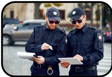
10. police station