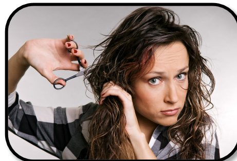
9. CUTTING MY HAIR