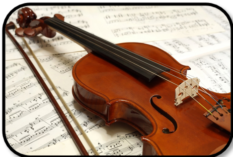
5. PLAYING THE VIOLIN