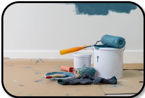
2. PAINTING THE LIVING ROOM