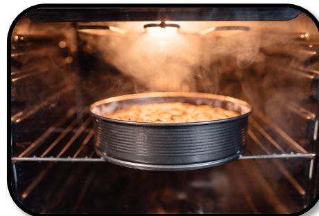
6. BAKING A CAKE