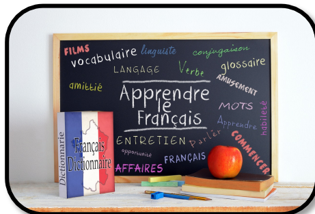
8. STUDYING FRENCH