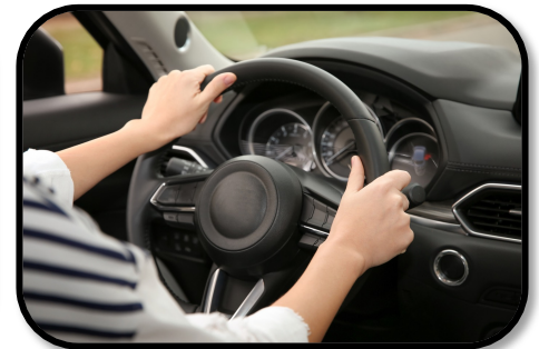
4. DRIVING HOME