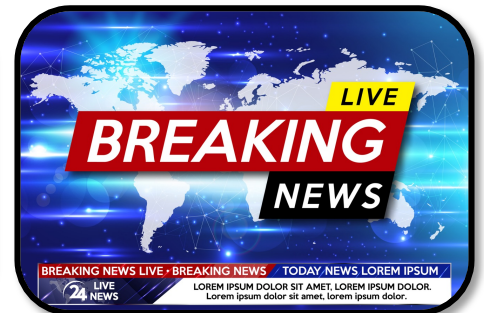
7. WATCHING THE NEWS