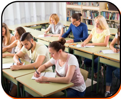
16. high school