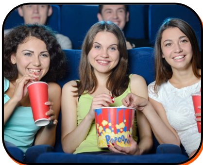
22. movie theater