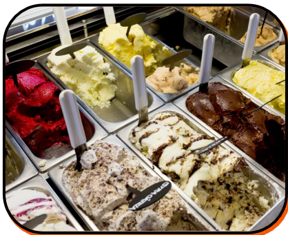
19. ice cream shop