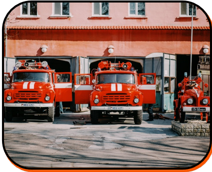
13. fire station