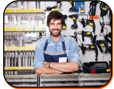
15. hardware store