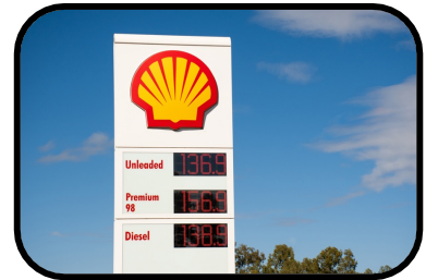
6. unleaded gas