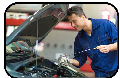
15. check the oil