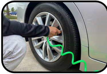
17. air pump