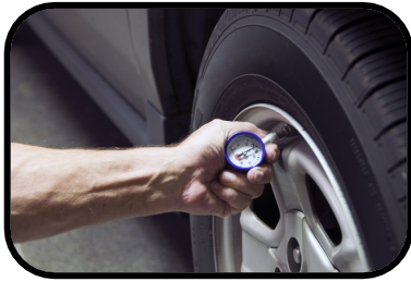
16. tire pressure