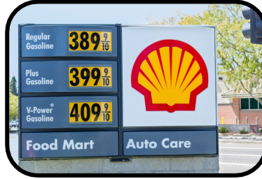
2. fuel price sign