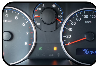
11. gas gauge