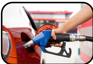
13. fill up