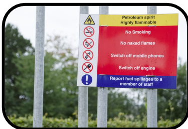
10. safety sign