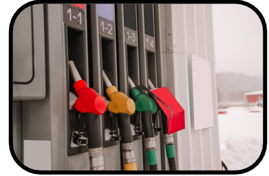
3. fuel dispensers