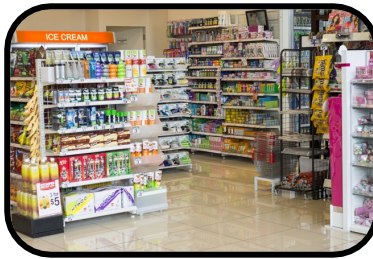
20. convenience store