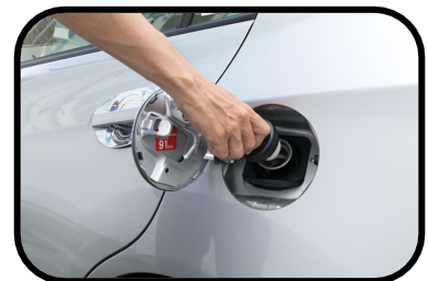
12. gas cap