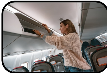
36. overhead bin