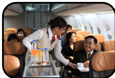
41. flight attendant