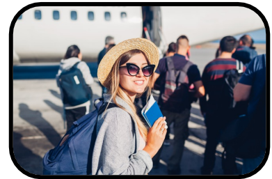
34. connecting flight