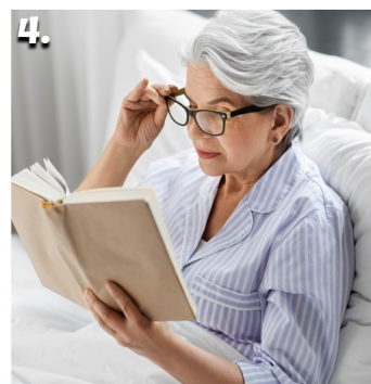
4. She reads for thirty-three minutes before bed.