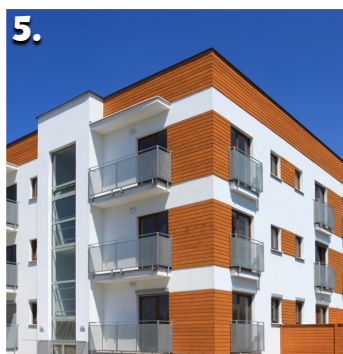
5. The building has eighty-eight windows.