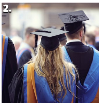
2. There are forty-four students in the graduation.