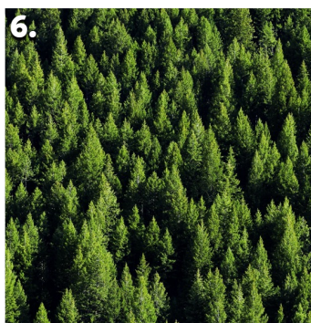
6. They planted nineteen trees.