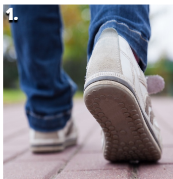
1. She walked fifteen blocks.