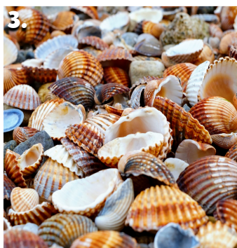
3. I found seventy-two seashells.