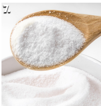
7. I need forty grams of sugar.