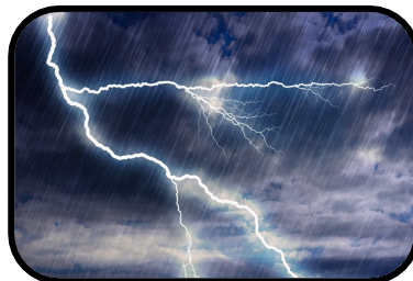
5. It's stormy.