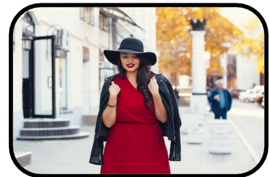
9. It's cool.