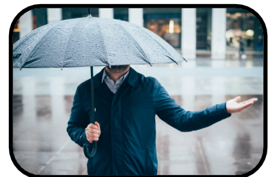
12. It's raining.