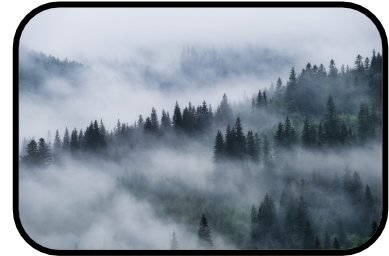
3. It's foggy.