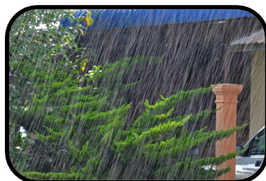
13. It's pouring.