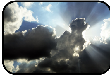
2. It's cloudy.