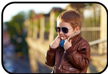
10. It's cold.