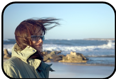
4. It's windy.