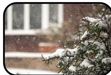
14. It's snowing.