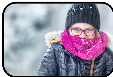
11. It's freezing.