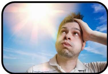
7. It's hot.