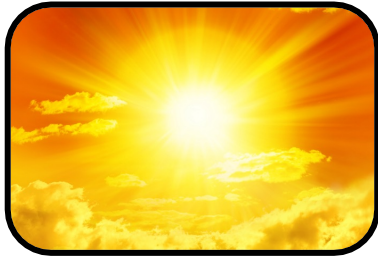
1. It's sunny.