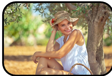
8. It's warm.