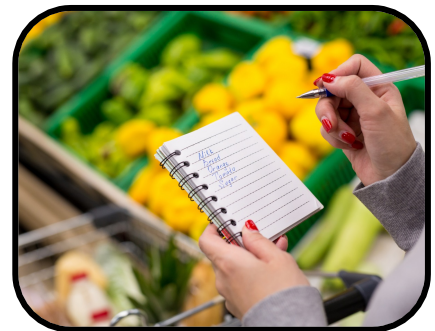
10. making a grocery list