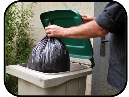
43. taking out the trash