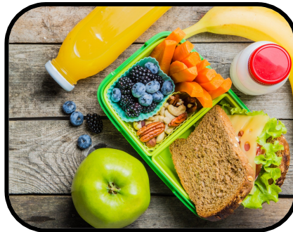
7b. having lunch