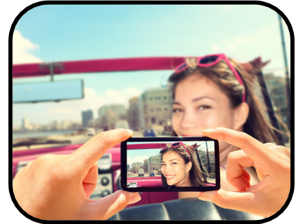
23. taking pictures