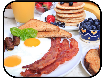
16a. making breakfast