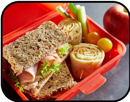
16b. making lunch