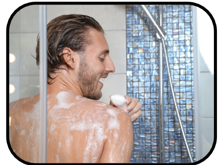
39. taking a shower