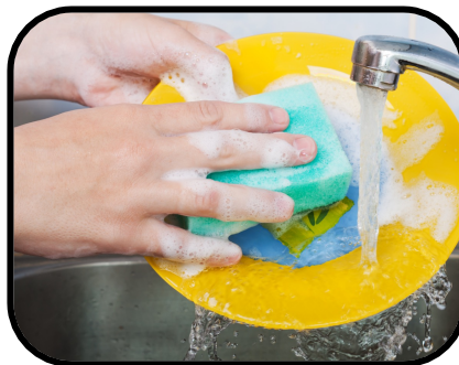
28. washing the dishes