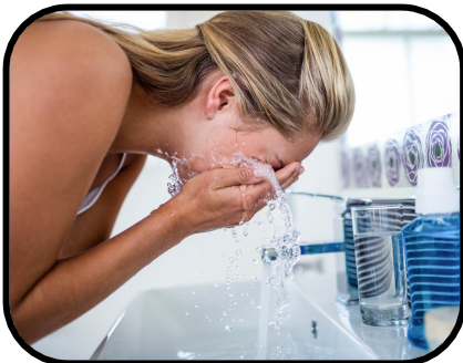
34. washing my face