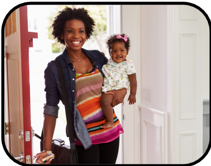
37. getting home