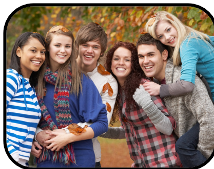
30. going out with friends