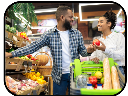
36. buying groceries