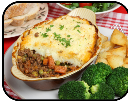
16c. making dinner