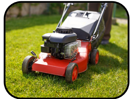
46. mowing the lawn