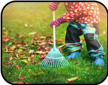
11. raking leaves