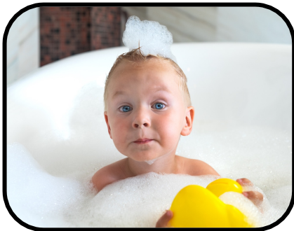
44. taking a bath