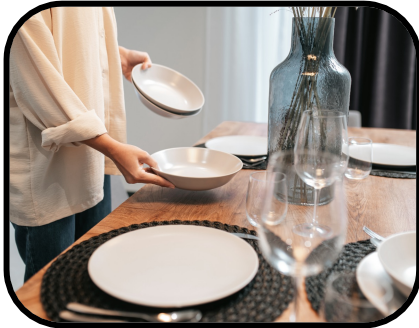
21. setting the table