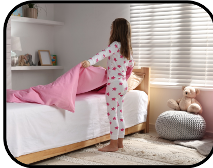
42. making the bed