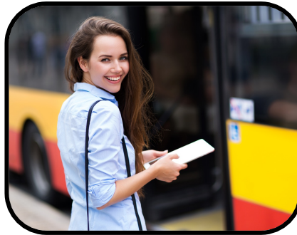
15. waiting for the bus