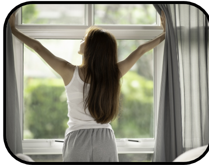
5. getting up