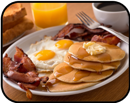
7a. having breakfast