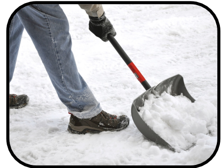
13. shoveling snow