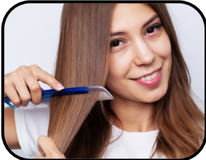
31. combing my hair