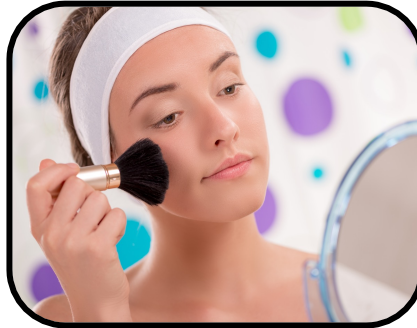
22. putting on makeup