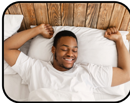
25. waking up