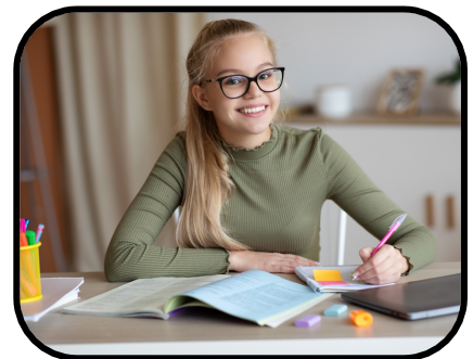
49. doing homework