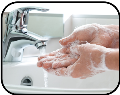
8. washing hands