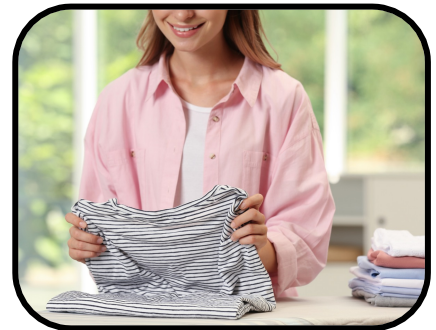
26. folding laundry