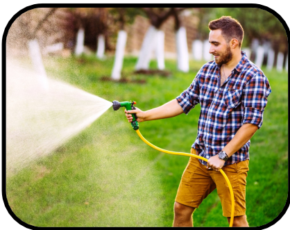
18. watering plants