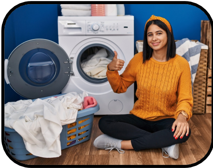
14. doing the laundry