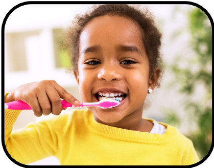
1. brushing teeth