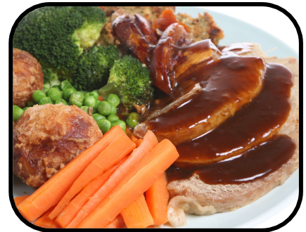
7c. having dinner