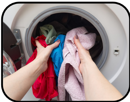
47. loading the washing machine