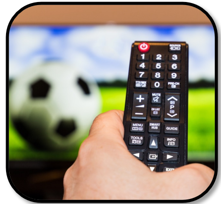
27. watch TV