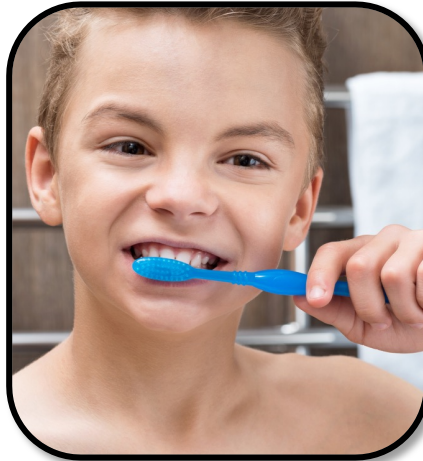
2. brush teeth