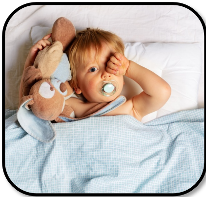
28. wake up