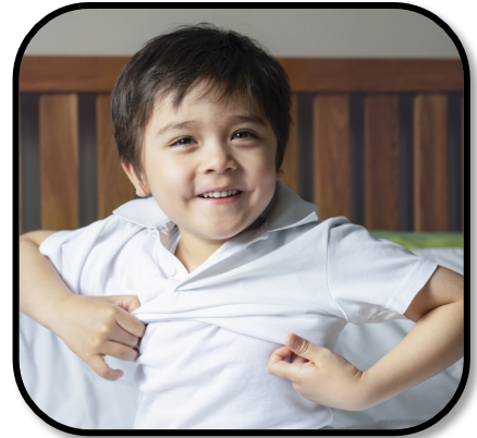
12. get dressed