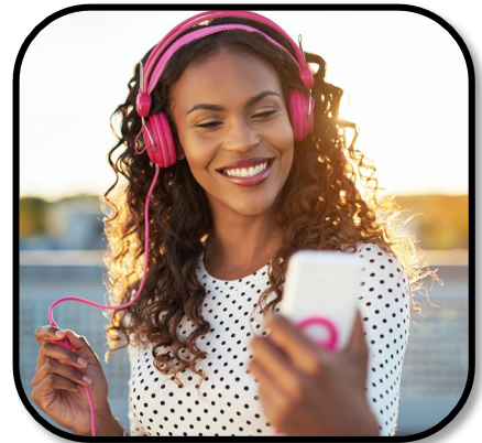
15. listen to music