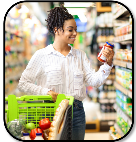
3. buy groceries