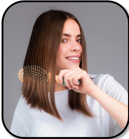
1. brush hair